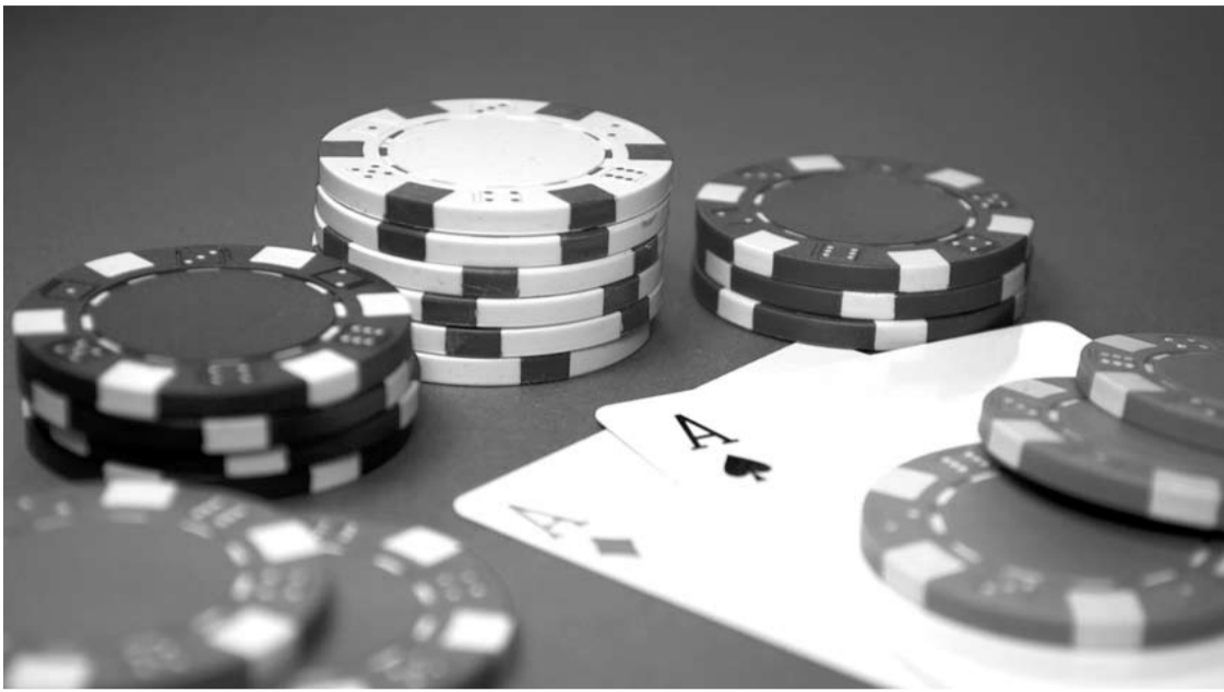
Žmonės azartiniai lošimai patraukia tuo, kad sukuria sėkmingo ir pelningo gyvenimo iliuziją.