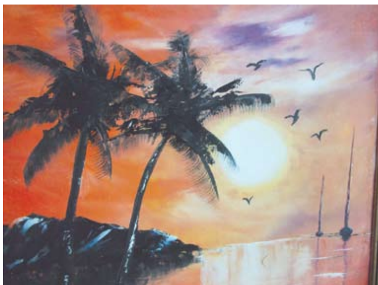
Prie šiltų vandenų.

Yra nutapiusi jau gerokai daugiau nei pusšimtį spalvingų nenusakomo stiliaus darbų. Dailis jų net iškelia į bičiulių, pažįstamų ar šiaip labai panorusių aplinką puošti jos paveikslais namus. Tematika labai įvairi - gamtos vaizdai, architektūra, jūra, kalnai, žmonės. Daugeliui patinka sentimentalus vaizdas, kurį pavadinusi „Laukimas“ - jame pavaizduota mergina balkone, žvelgianti į tolimas, kažko laukianti. Moteriškai subtilus darbelis „Meditacija“. Tarsi iš vandenyno kyla namai, primenantys Manheteną, o gal Arabų Emiratus. Palmės besileidžiančios saulės nurausvintų vandens fone, į rudens varšomis mirgantį vandenį krentan-