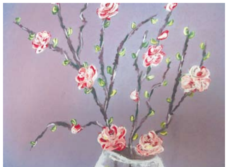
Vystančių žiedų puokštė.