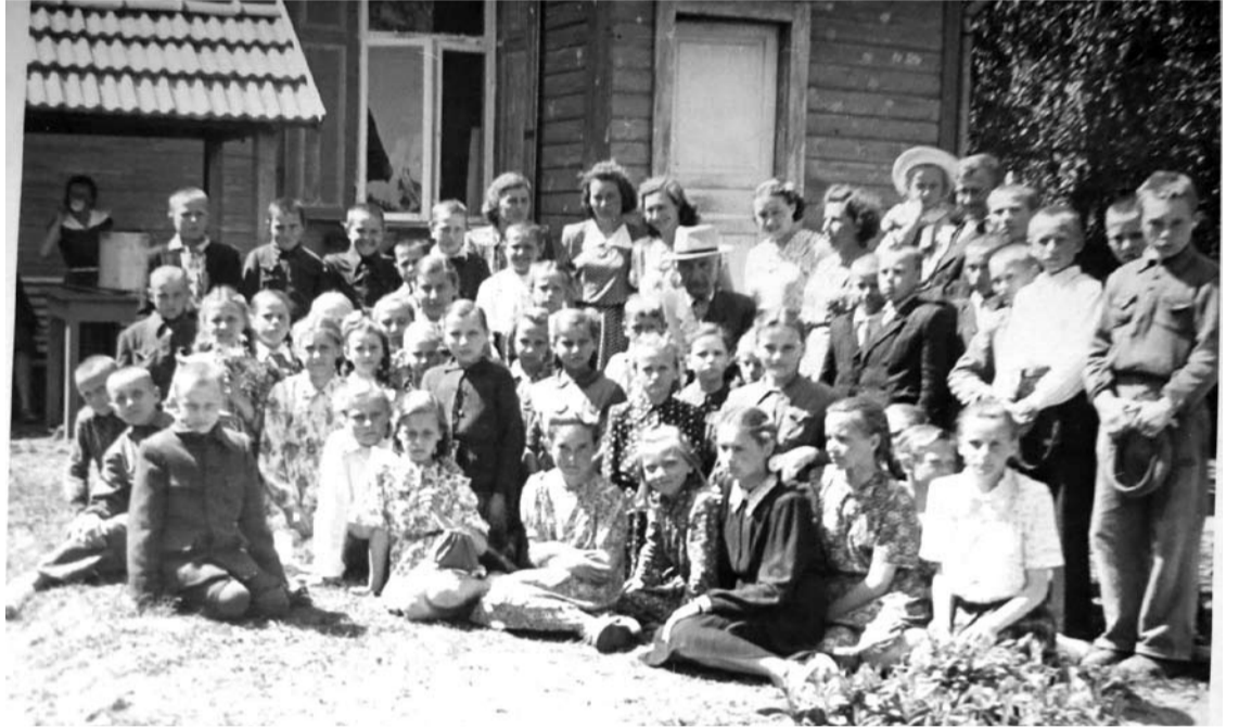
Ekskursijos į Anykščius metu mokinukai buvo supažindinti su rašytoju A. Vienuoliu-Žukausku.