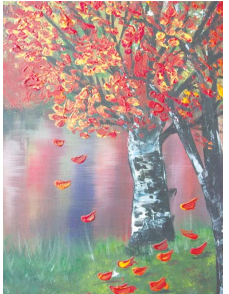
Prie liepsnojančio medžio...