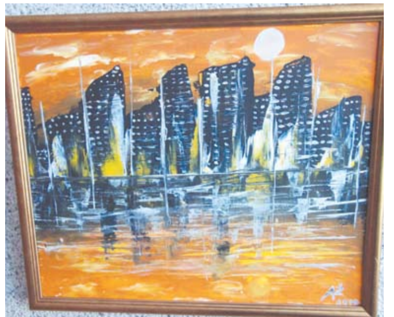
Iš vandenyno išnyrantis miestas.